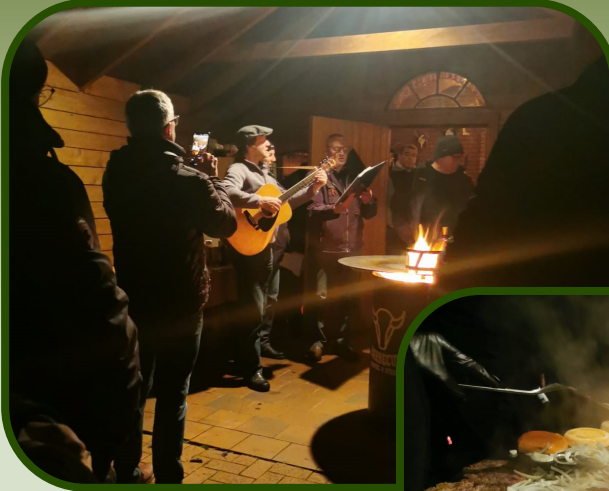
Männertreff „Burger grillen“